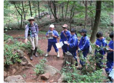
(山門水源の森にて)