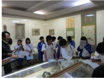
(菅浦郷土史料館にて)